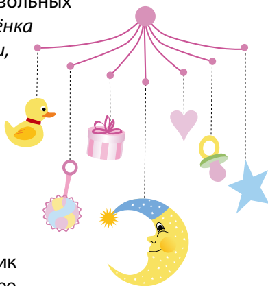
Возраст 0–3 месяца

4. Вместо мобиля можно использовать разноцветные летающие воздушные шары, наполненные гелием. Привяжите к руке ребёнка конец верёвочки от шарика. Покажите малышу, двигая его рукой, что он может заставить двигаться шарик. Можно на этом же шнурке, рядом с шариком, укрепить колокольчик или бубенчик. Это будет ребёнку ещё интереснее.