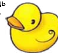
Возраст 0–3 месяца

6. Возьмите игрушку со сложной или бугристой поверхностью — такую, чтобы её было удобно схватить. Положите её на грудь ребёнка, соедините на ней обе его ручки. Вероятно, он её схватит. Хорошо, если игрушка будет издавать звук при сдавливании.